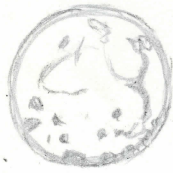
stämpel i nat. storlek

3) svart grepp med spetsen nedåt; mått samma greppspetsens (ej medräknat): 2,29 (greppspets- 2,2 (greppspets nedre kant) - 2,14 m; diam. upp- 0,036 - 0,034 m; sv svart, brunfärdad; nedtill och grovt vävad. 4) spets, sv 5) märkning. ma kyrkan No 166. B. på stångens nedre parti fäst- upp med påskrift: "No 22 Byrk fäns ståndart fäns d. 9. aug. 1701"; på palmevådas flygsidans stämning av en försvunnen påpapperskäft.